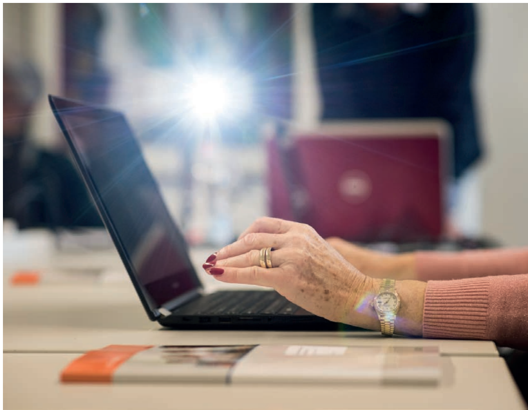
Zurück ins Studium: Die FernUni Schweiz bietet neuerdings speziell Kurse für die älteren Semester an.

Universitäre Hochschulen haben einen Vierfach-Auftrag. Ne-