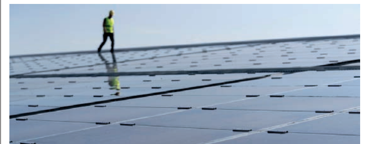
Ein willkommener Zustupf für Solar-Installationen.